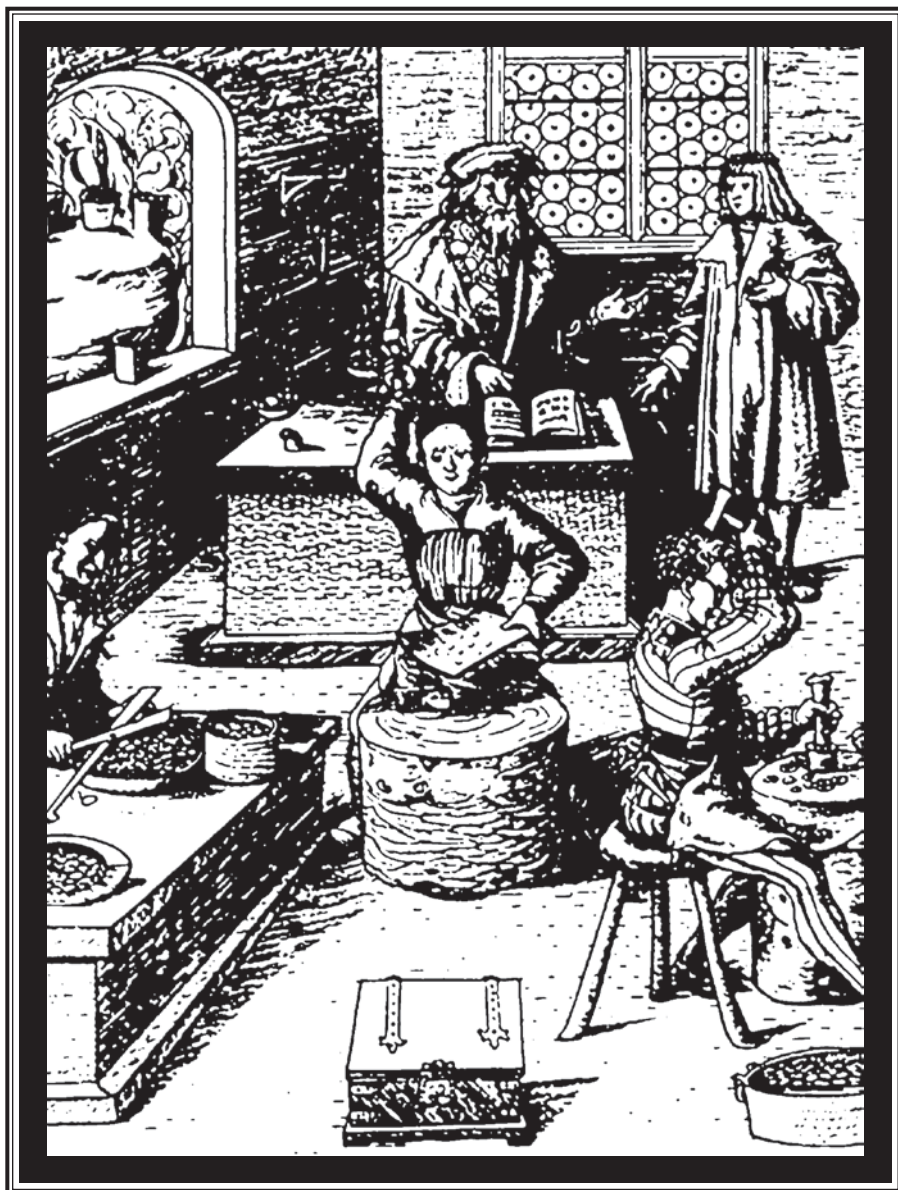
Cunhagem de moeda